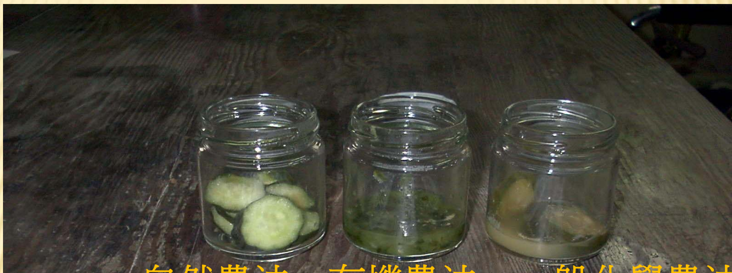
自然農法 有機農法 一般化學農法